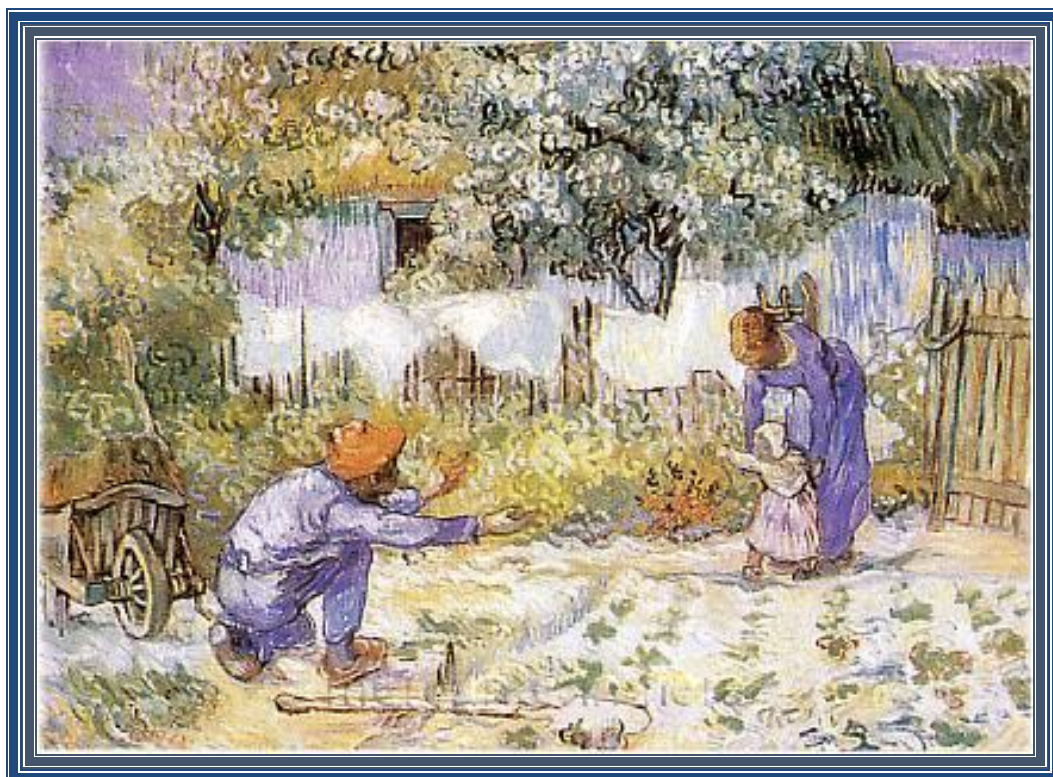
"Primi passi" V. Van Gogh